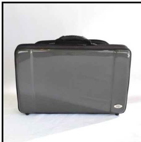
GRAFITO - GRAPHITE GRAPHIT