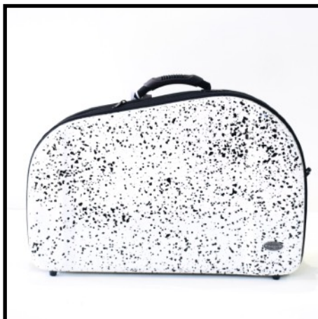
FUSION BLANCO - WHITE FUSION FUSION BLANC - WEISS FUSION