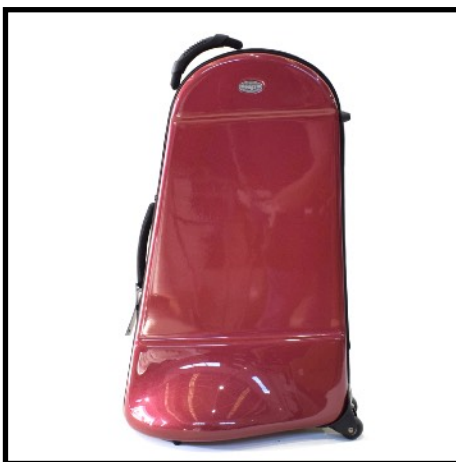
ROJO - RED ROUGE - ROT