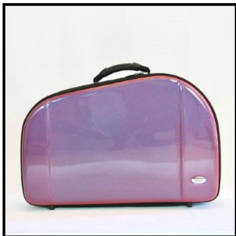
FUCSIA - FUCHSIA FUCSIA