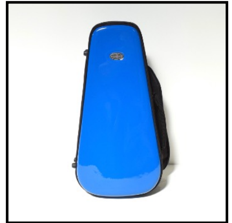
AZUL - BLUE BLEU - BLAU