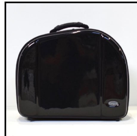
NEGRO - BLACK NOIR - SCHWRAZ