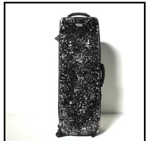
FUSION NEGRO - BLACK FUSION FUSION NOIR - SCHWRAZ FUSION