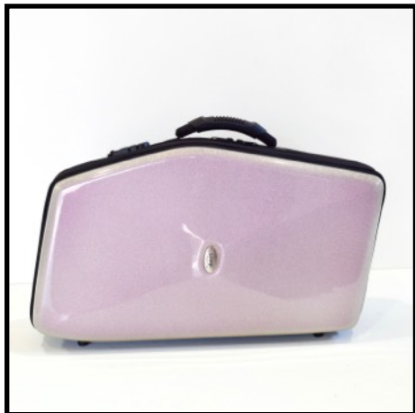
ROSA - PINK ROSE - ROSA