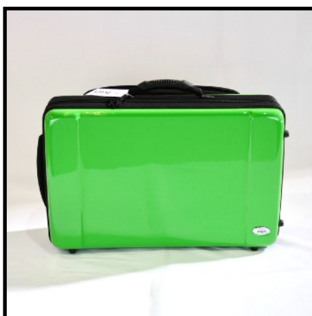
VERDE - GREEN VERT - GRÜN