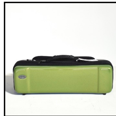
VERDE - GREEN VERT - GRÜN