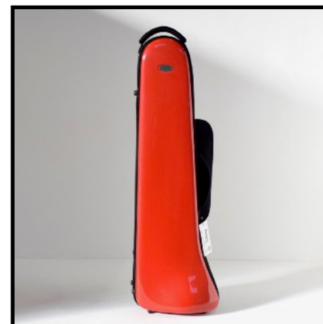
ROJO CLARO - LIGHT RED ROUGE CLAIRE - HELLROT