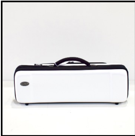
BLANCO - WHITE BLANCO - WEISS