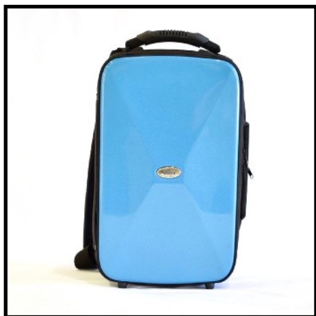
AZUL - BLUE BLEU - BLAU