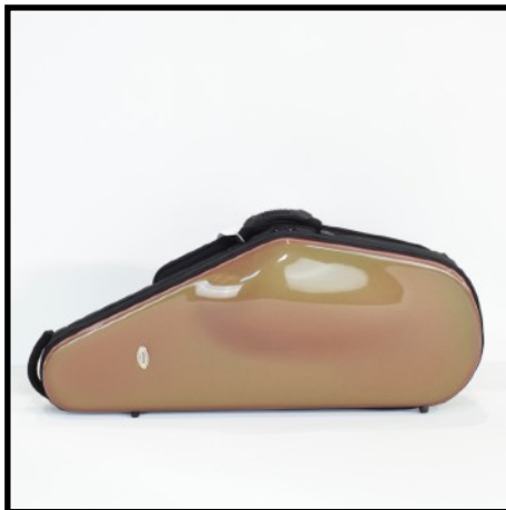
TABACO - TOBACCO TABAC - TABAK