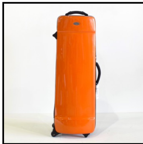
NARANJA - ORANGE