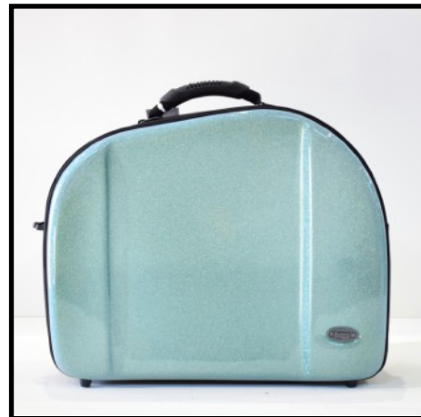
AZUL/VERDE - BLUE/GREEN BLEU/VERT - BLAU/GRÜN