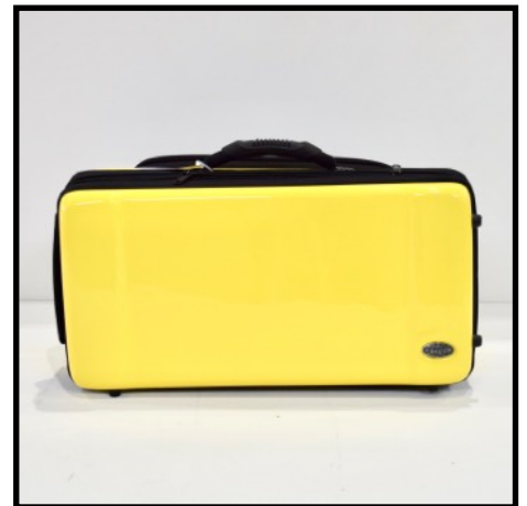
AMARILLO - YELLOW JAUNE - GELB