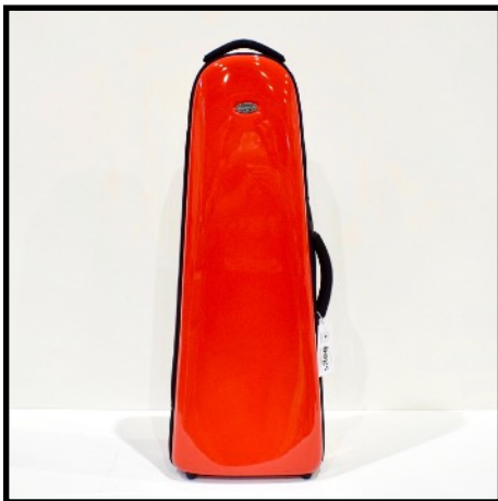
ROJO - RED ROUGE - ROT