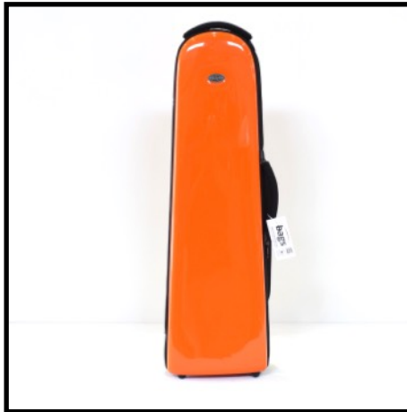
NARANJA - ORANGE