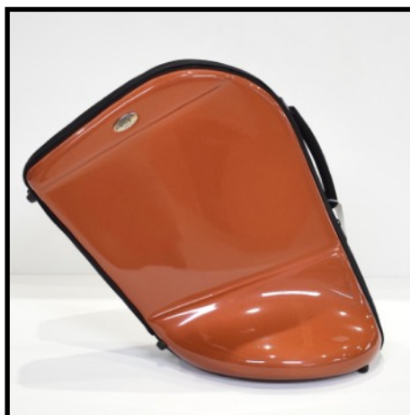
COBRE - COPPER CUIVRE - KUPPER