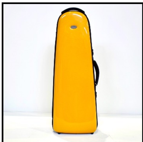
ORO - GOLD OR - GOLD