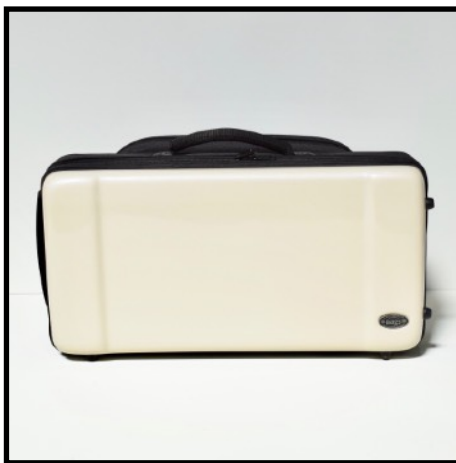
NACAR - NACRE NACRE - PERLMUTT